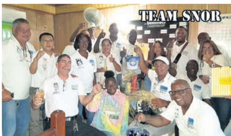
adomingo awor 15 di december, cuminsando pa 1'or di merdia, Team Snor bou guia di e flamante Snor Perez lo ta bay tin nan dia di huicio! Dificil pa bisa kende(nan) lo bay cu e copa e aña aki, ya cu segun un chuchubi a fluit,

Luna di december te luna di Nos cu Nos, y e biaha aki di-